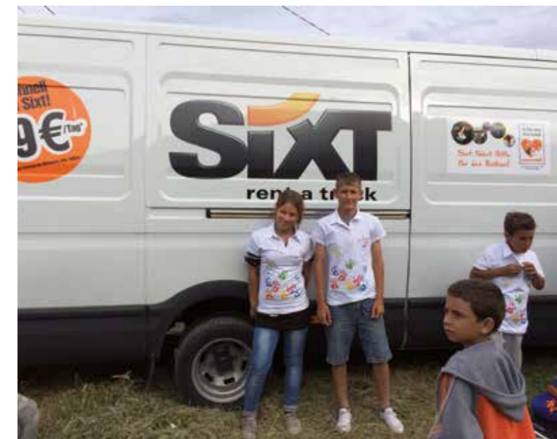
Nach und nach starteten über zehn Sixt-Transporter von München, Rostock, Wien, Frankfurt und anderen Städten in Deutschland, um Hilfsgüter in die betroffenen Regionen zu bringen.