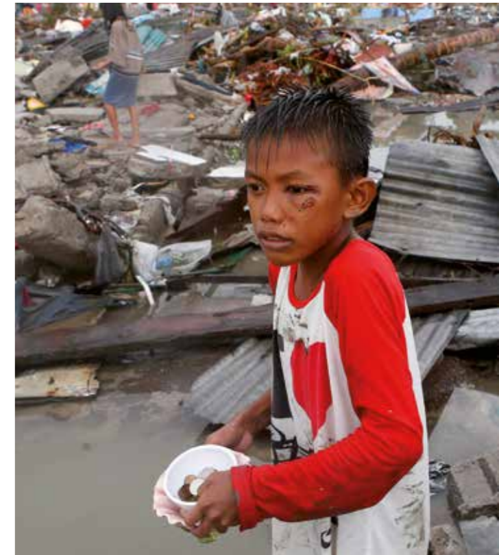
Die Regine Sixt Kinderhilfe Stiftung schickte in der Nothilfephase mit der Unterstützung von Air France, Malteser International und dem philippinischen Malteser Orden 40 Großzelte sowie 300 Ponchos in das Katastrophengebiet auf den Philippinen.

Die Regine Sixt Kinderhilfe Stiftung ermöglicht durch ihre Spende eine umfangreiche Bausanierung sowie die Erneuerung der Außenanlagen mit den Sportplätzen. In Zukunft soll damit u.a. verhindert werden, dass eine neue Flut wieder solche verheerenden Schäden anrichten kann.