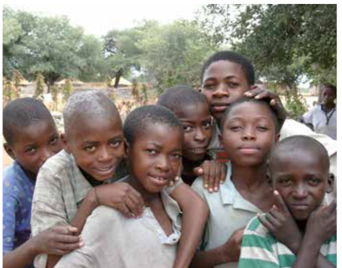
Die Regine Sixt Kinderhilfe Stiftung realisiert durch ihre Spende den Bau eines Straßenkinderzentrums zur Reintegration der Straßenkinder in die Gesellschaft in Rundu (Bild o. + re..