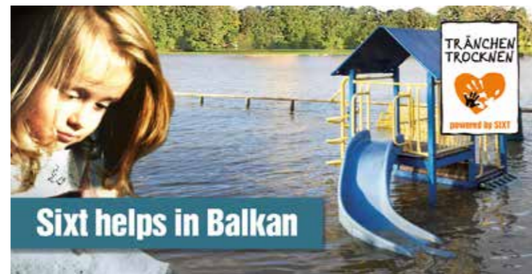
More than ten Sixt vans gradually set off from Munich, Rostock, Vienna, Frankfurt, and other German cities to bring relief supplies to the affected regions.