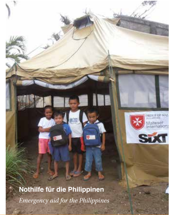
Nothilfe für die Philippinen Emergency aid for the Philippines

Sound studio for Youth Center in Hamburg