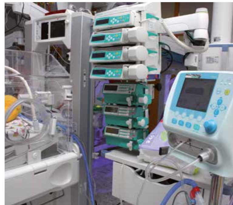
The Institute for Care of Mother and Child (ICMC) in Prague is the biggest medical facility specializing in prenatal medicine in the Czech Republic, and is famous for its exceptional infant care.

Together with BUSINESS TRAVELLER, Regine Sixt Children’s Aid Foundation is supporting a sponsorship project for the renovation and development of a children’s home for sick, neglected, and orphaned children on the premises of Blessed Gérard’s Care Center in Mandeni, South Africa. The whole building needs to be repainted, tiles need laying, and new plumbing and doors are needed; sockets and light switches need replacing, and new fans need installing. The children in this home are from dysfunctional, alcoholic and HIV-infected families, and to them it is a safe haven where they can feel at ease. Support from the Regine Sixt Children’s Aid Foundation and BUSINESS TRAVELLER has helped give them a beautiful and safe environment.