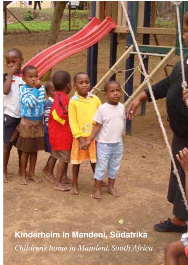
Kinderheim in Mandeni, Südafrika Children's home in Mandeni, South Africa