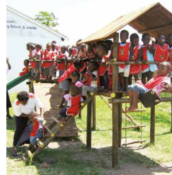
A sponsorship project for the renovation and development of a children’s in Mandeni.