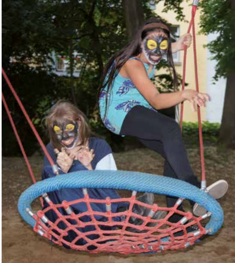
Seit zwei Jahren engagieren sich auch Sixt Mitarbeiter aus Duisburg für dieses Projekt und besuchen mit den Kindern der Kinderdialyse Köln die „Dreamnight at the Zoo“ im Zoo Köln.

"It was a great evening which we enjoyed very much, being able to move around without worrying, and to visit every enclosure without being stared at."