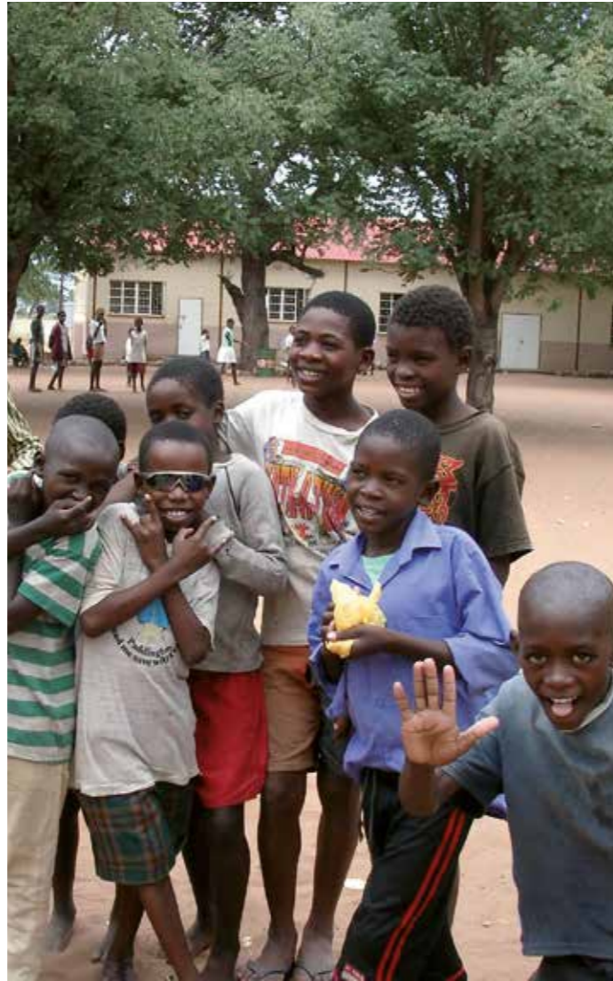
The Regine Sixt Children’s Aid Foundation donated money to build a street children’s center in Rundu for the reintegration of street children into society.

By helping this facility, the Regine Sixt Children’s Aid Foundation is providing many children and young people with access to education and various other activities.