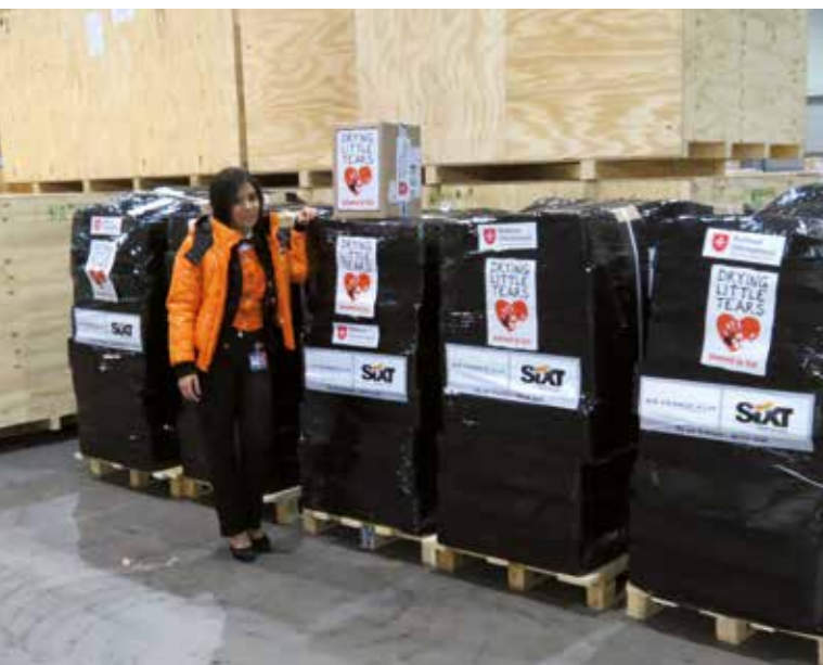
During the emergency relief phase, the Regine Sixt Children's Aid Foundation collaborated with Air France, Malteser International, and the Philippine Order of Malta to deliver 40 large tents and 300 ponchos to the disaster area.

During the emergency relief phase, the Regine Sixt Children's Aid Foundation collaborated with Air France, Malteser International, and the Philippine Order of Malta to deliver 40 large tents and 300 ponchos to the disaster area. These large tents allowed children to attend school again in enclosed rooms, and were also used as temporary kindergartens and community rooms.