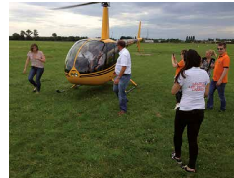
Das Lächeln in den Gesichtern der Kinder zeigte, dass sie der Helikopter-Rundflug – für jeden von ihnen war es das erste Mal – doch ziemlich beeindruckt hat.

„Es war ein toller Abend und wir haben es sehr genossen, uns unbeschwert bewegen zu können und nicht an jedem Gehege angestarrt zu werden.“